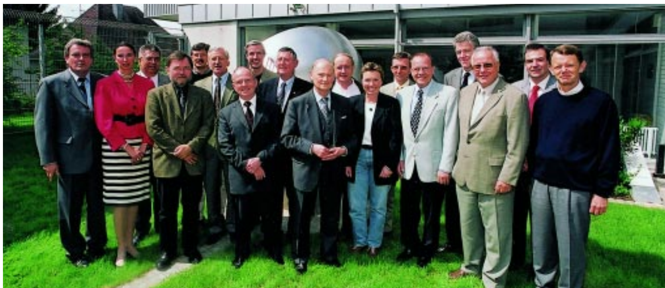
Der Verwaltungsrat mit den Vorsitzenden der Vertreterversammlung